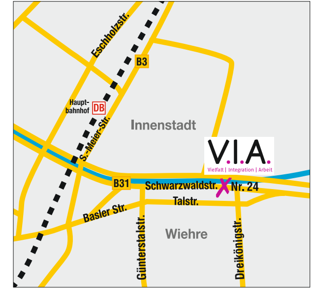
V.I.A. | Schwarzwaldstr. 24 | 79102 Freiburg